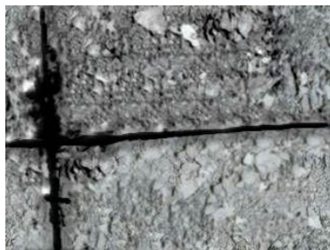
Rys. 2: Erupeja wody ze szczeliny wzdłużnej między pasem ruchu a pasem postojowym – z cząstkami drobnymi i z piaskiem z hydromielenia.

Erozja warstwy nośnej prowadzi siłą rzeczy do pogorszenia warunków posadowienia i podwyższonego obciążenia nawierzchni betonowej. Mogą tworzyć się rysy, później różnice poziomów powierzchni poszczególnych płyt oraz ich przechylenia. Uszkodzenia te decydują o wartości użytkowej oraz czasokresie użyteczności nawierzchni betonowej.