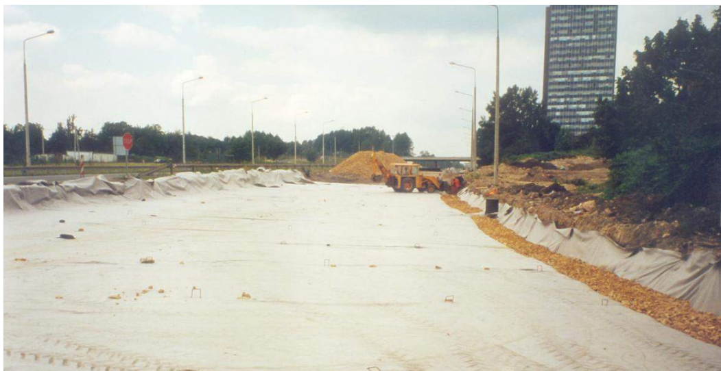
Rys. 4: Geowłóknina ułożona na całej powierzchni. Po prawej stronie odwodnienie 19 metrów szerokości pasa autostrady przy pomocy tzw. „drenu francuskiego”. (modernizacja wg technologii P.R. INORA® odcinka Al. Górnośląskiej [Katowice] w ciągu autostrady A-4 Katowice – Kraków, lipiec 1999 r.).

Przy pomocy geotekstyliów od samego początku uzyskano powierzchniowo pełne rozdzielenie eliminujące przyczepność pomiędzy płytą betonową a podkładem.