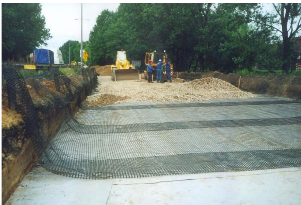
Rys. 5: Zastosowanie materaca geosyntetycznego pozwala na wydatne zmniejszenie grubości warstw konstrukcyjnych podbudów mineralnych jak też i warstw nawierzchni betonowych.

W ostatnich latach przez Niemieckie Konsorcjum Budowy Autostrad DEGES zbudowanych zostało osiem większych odcinków autostrad z warstwą geotekstyliów między nawierzchnią betonową a warstwą nośną związaną środkami hydraulicznymi (rys. 5).